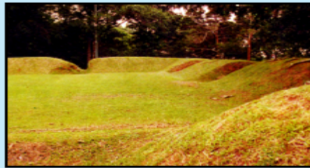
Pelan dan benteng Kota Batu.