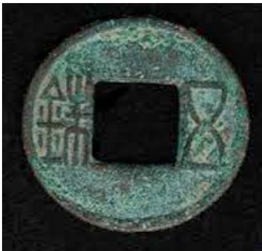
Mata wang zaman Shih Huangdi.

Maharaja Shi Huangdi juga telah bertindak untuk menyeragamkan sistem ukuran, menyatukan unit timbang dan sukat, menyeragamkan mata wang dan menyeragamkan tulisan. Usaha ini telah menyumbang kepada pembentukan sistem tulisan China moden pada hari ini.