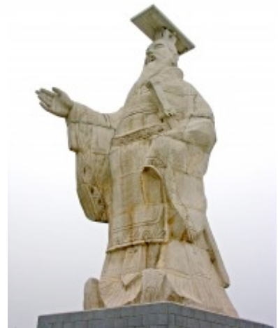
Patung Maharaja Shi Huangdi.

Kejayaan ekspedisi ketenteraan Raja Zheng telah menyatukan China. Buat pertama kalinya, semua negeri berada di bawah satu pemerintahan, iaitu Dinasti Qin. Kemunculan Raja Zheng dilihat membawa pembaharuan dalam sistem pemerintahan di China sebagai seorang pemerintah yang unggul dan teragung. Bagi menonjolkan keagungan inilah beliau memakai gelaran Maharaja Shi Huangdi. Gelaran ini menunjukkan bahawa beliau adalah raja segala raja yang paling unggul di dunia.