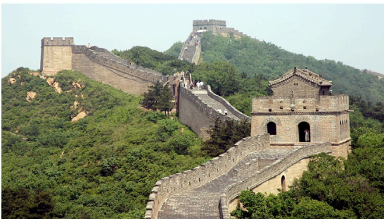
Tembok Besar China.