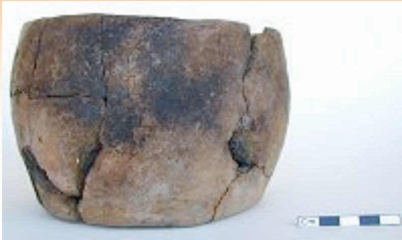
Tembikar di Catal Huyuk

Penemuan cincin yang diperbuat daripada tulang yang merupakan sebahagian daripada perhiasan yang dipakai oleh masyarakat pada ketika itu.