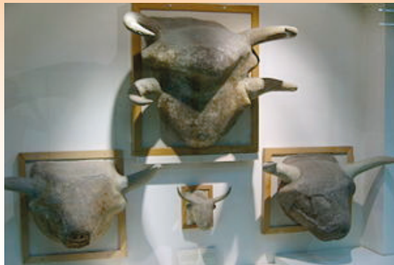
Kepala kerbau yang ditemui dalam bilik pemujaan di Catal Huyuk