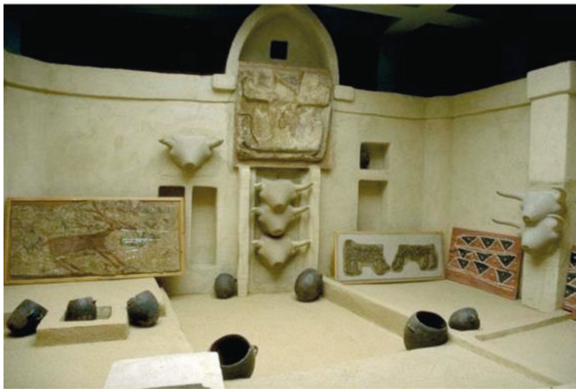
Catal Huyuk Shrine Room

Suasana bilik pemujaan di Catal Huyuk