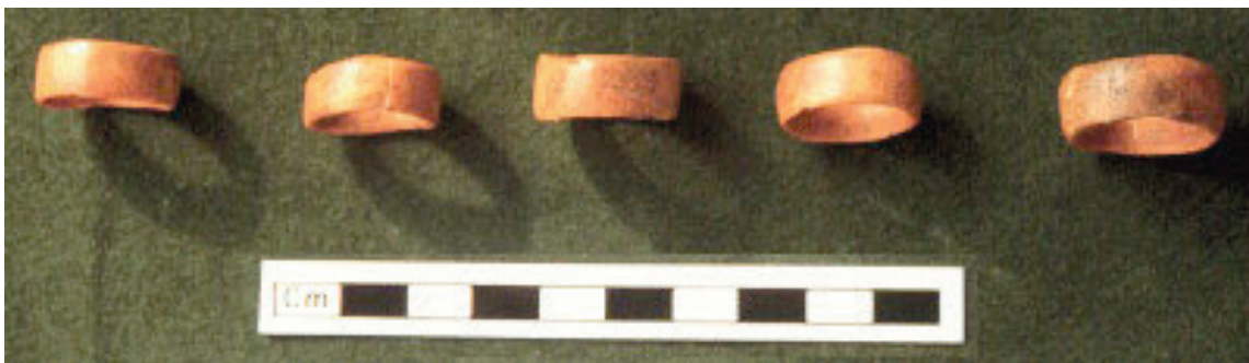
Cincin daripada tulang haiwan

Penemuan cincin yang diperbuat daripada tulang yang merupakan sebahagian daripada perhiasan yang dipakai oleh masyarakat pada ketika itu.