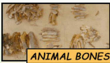
Tulang haiwan di Catal Huyuk

Penemuan pelbagai tulang haiwan di Catal Huyuk menunjukkan penduduk telah menjalankan aktiviti penternakan haiwan. Ini secara langsung menepati ciri kehidupan masyarakat Neolitik. Antara tulang haiwan yang ditemui ialah kambing, lembu, khinzir dan biri-biri. Masyarakat Catal Huyuk juga didapati menjalankan aktiviti memburu kerana adanya tulang rusa dan elk serta pelbagai jenis burung.