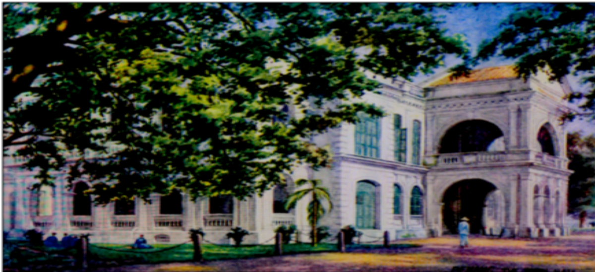
Dewan Perbandaran Pulau Pinang

Bangunan Mahkamah Agung terletak di persimpangan Jalan Light dan Jalan Pitt, Pulau Pinang siap dibina pada tahun 1905. Bangunan tersebut berfungsi selama beberapa tahun sebagai pusat pentadbiran Negeri-Negeri Selat.