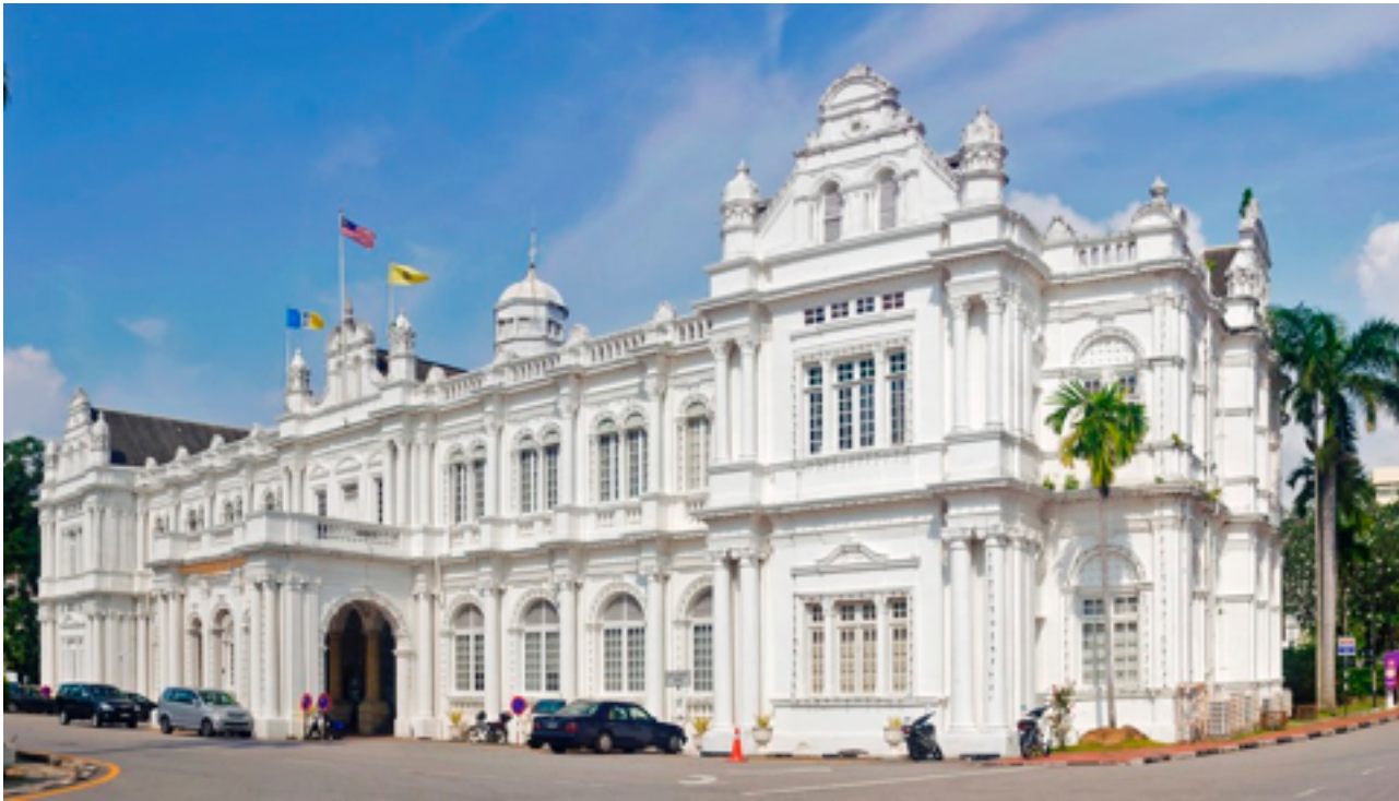
Majlis Bandaraya Pulau Pinang

Pada hari ini bangunan tersebut dikenali sebagai Majlis Bandaraya Pulau Pinang