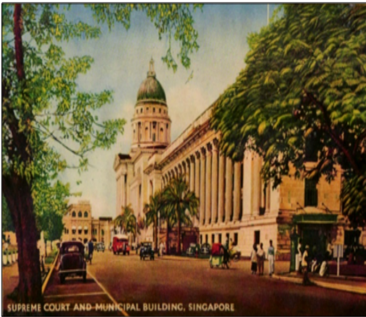
Bangunan Mahkamah Agung dan Bangunan Perbandaran Singapura (1930-an)

Pada hari ini bangunan tersebut dikenali sebagai Majlis Bandaraya Pulau Pinang