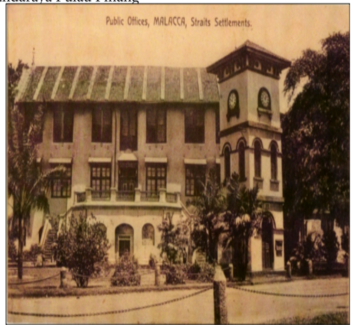
Pejabat Awam, Melaka (1920-an)